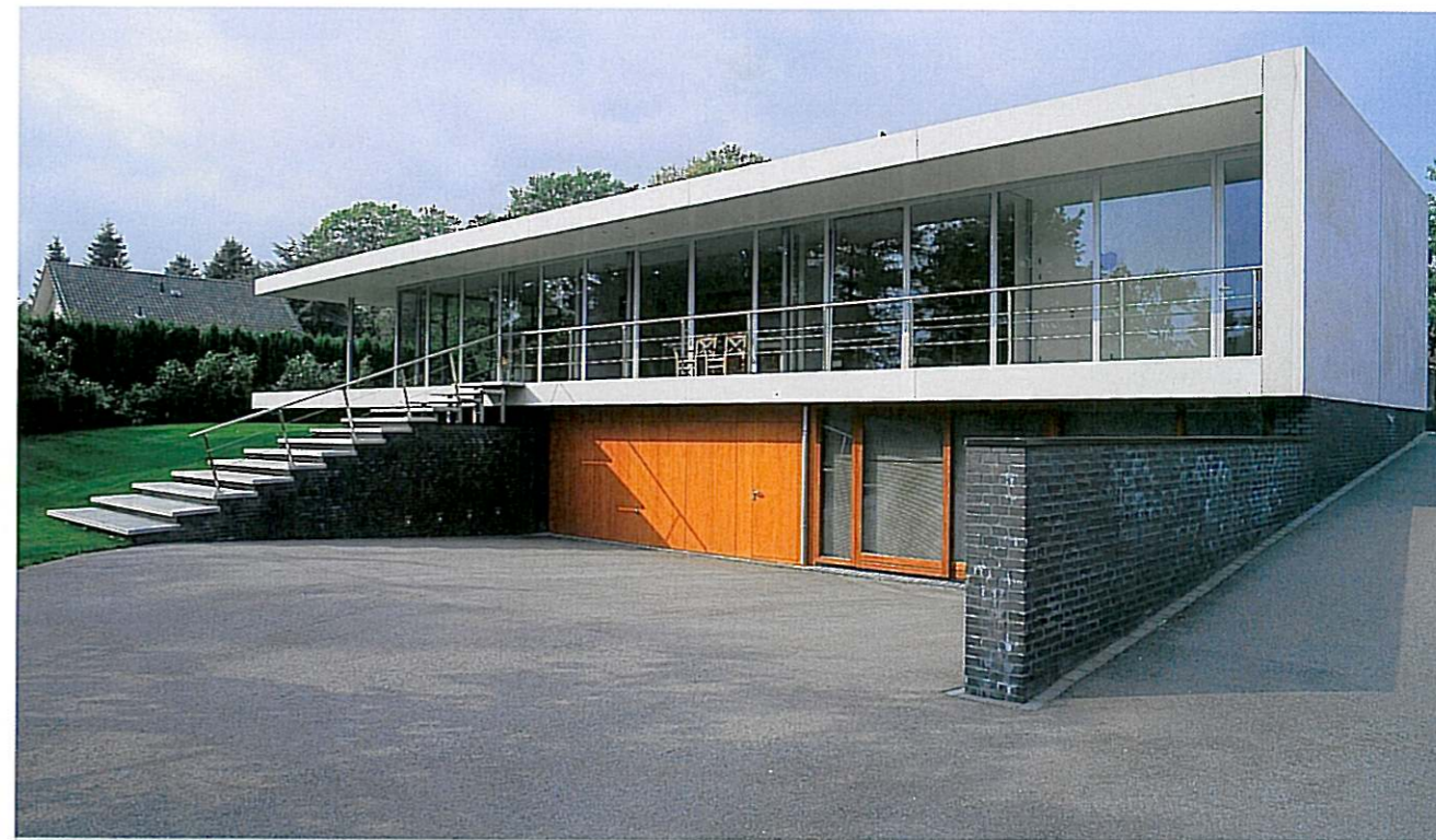
Onder de woonvertrekken bevinden zich de dubbele garage én het atelier dat een aparte opgang heeft.

Tjin-A-Sie: 'Met die lange wand moest iets spannends gebeuren. De oplossing lag in de combinatie van spiegellende en zwarte vlakken onder het wateroppervlak en matglazen en heldere lichtvlakken - uiteraard van veiligheidsglas - op de wand. 's Avonds verandert het beeld en worden donkere vlakken licht en lichte vlakken donker. Omdat je voor reparaties bij de lampen moet kunnen, zijn aan de buitenzijde ramen gemaakt met slotjes.' Bijkomend voordeel is dat de langgerekte achtergevel van donkere strengperssteen zo een