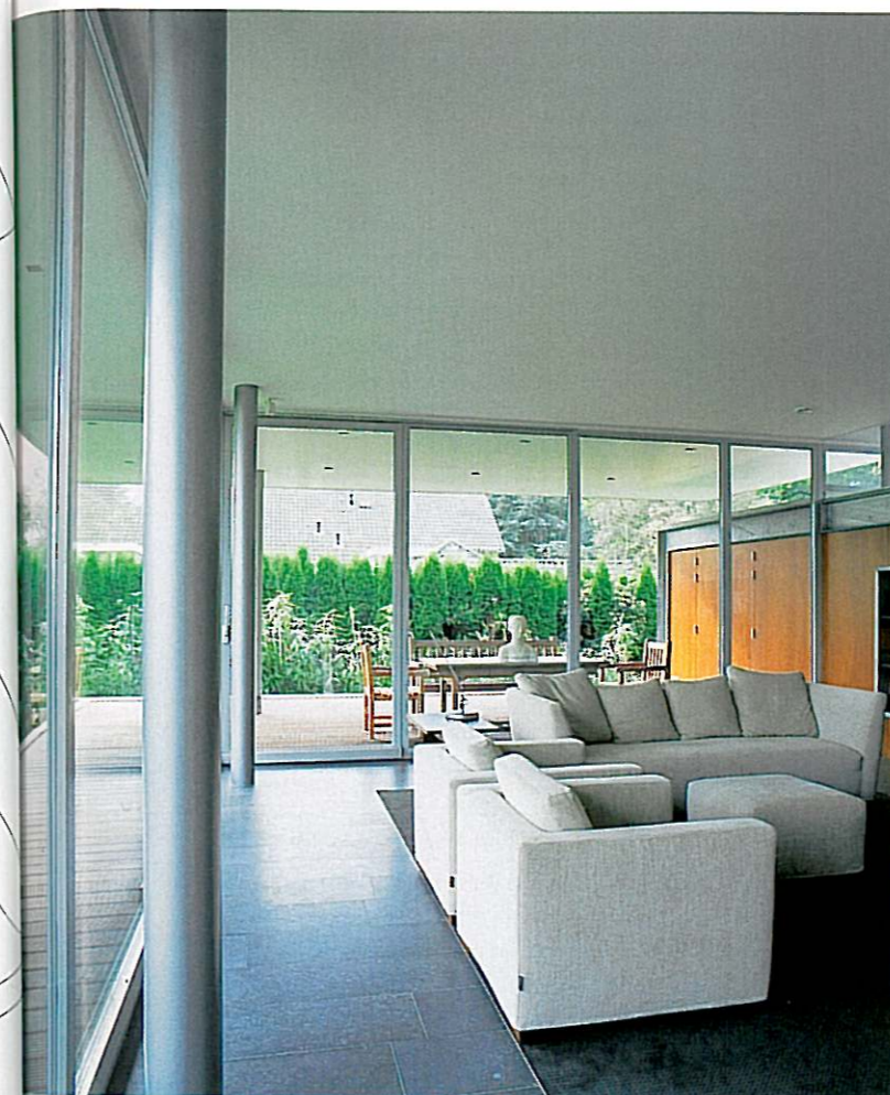
Door de grote glaspartijen en de iroko kastenwand in de woonkamer en op het terras, lopen buiten en binnen bijna naadloos in elkaar over.