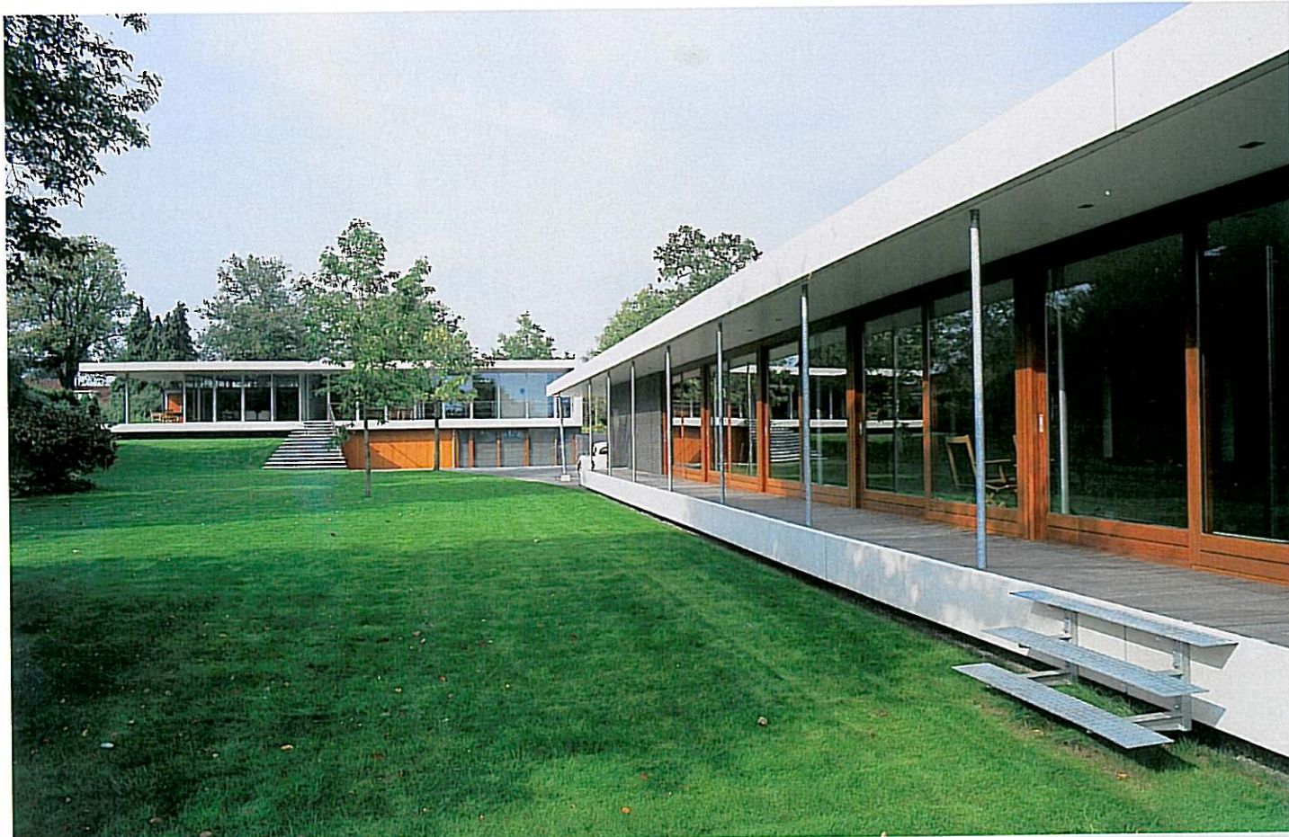
Door de plaats van de woning en het zwembadgebouw worden de lengte en breedte van de kavel extra benadrukt. Het tuinontwerp - onderhoudsarm en afgestemd op de omgeving - is van landschapsarchitect Willem Verhoeven.