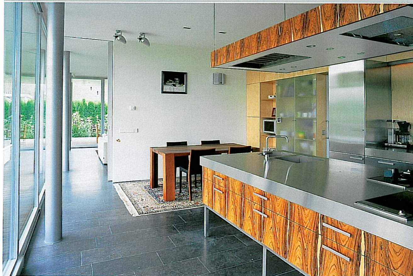
De woonkeuken - een mix van Palissander en roestvrij staal eveneens een ontwerp van Tjin-A-Sie - is uitgevoerd door Hans Croes Keukens Interieurwerken. De apparatuur is van Imperial.