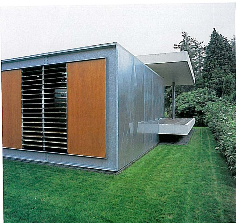
Karakteristiek is het gebruik van pure bouwmaterialen als staal en irokoehout voor de voorzijde en glas en beton voor de achterzijde. Door de overstekende veranda lijkt het alsof de woning zweeft.