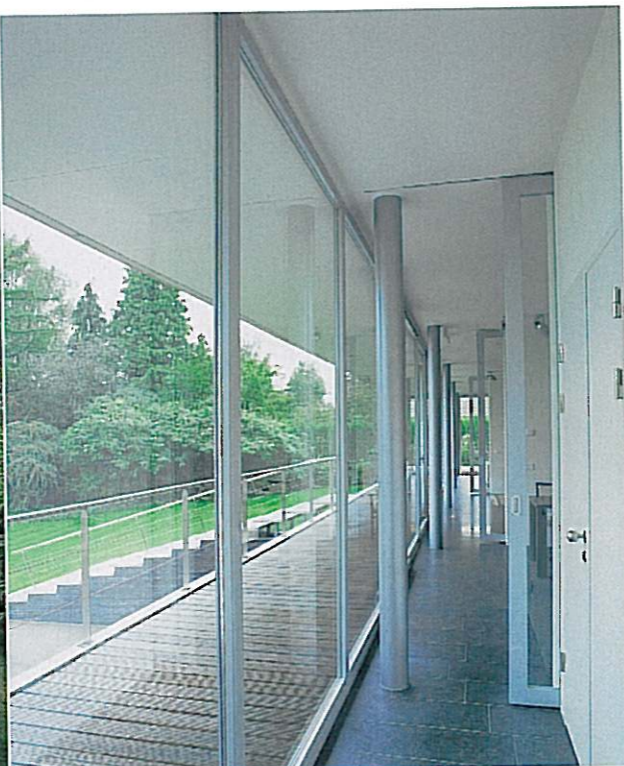
Traditionele gangen ontbreken, kantoor, keuken en woonkamer staan in open verbinding. Een principe zoals dat al tijdens de Renaissance werd toegepast. Wie privacy wil, sluit een van de schuifdeuren.

lijnen en een duidelijke materiaalkeuze: beton, staal, glas en hout.' Bedrieglijke eenvoud. Tjin-A-Sie: 'Hoe eenvoudiger iets lijkt, hoe lastiger het is om te maken. Aannemers hebben de neiging alles af te timmeren en weg te stoppen. Bij dit ontwerp wilden we juist niets verbloemen, maar alle onderdelen in hun pure vorm laten zien. Dat betekent dat je steeds naar oplossingen moet zoeken. Met aftimmerlatten bijvoorbeeld kun je een kozijn makkelijk afwerken. Maar ik wilde juist géén aftimmerlatten laten zien. Zo zijn er bijvoorbeeld ook nergens plinten zichtbaar, want deze zitten in het vlak van de wand. Voor de aannemer waren dit soort dingen een regelrechte ramp.'