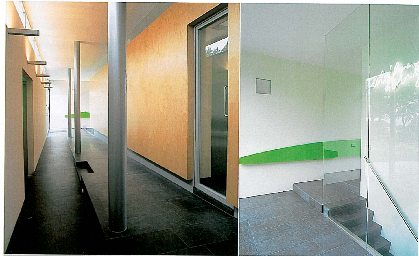
De woning bestaat uit twee in elkaar geschoven volumes. In de zone waarin deze elkaar overlappen is een hoogteverschil dat wordt overbrugd met deze hellingbanen.