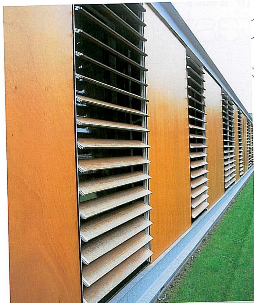
De horizontale lamellen regelen de lichtinval in de slaap- en badkamers en staan garant voor extra veiligheid.