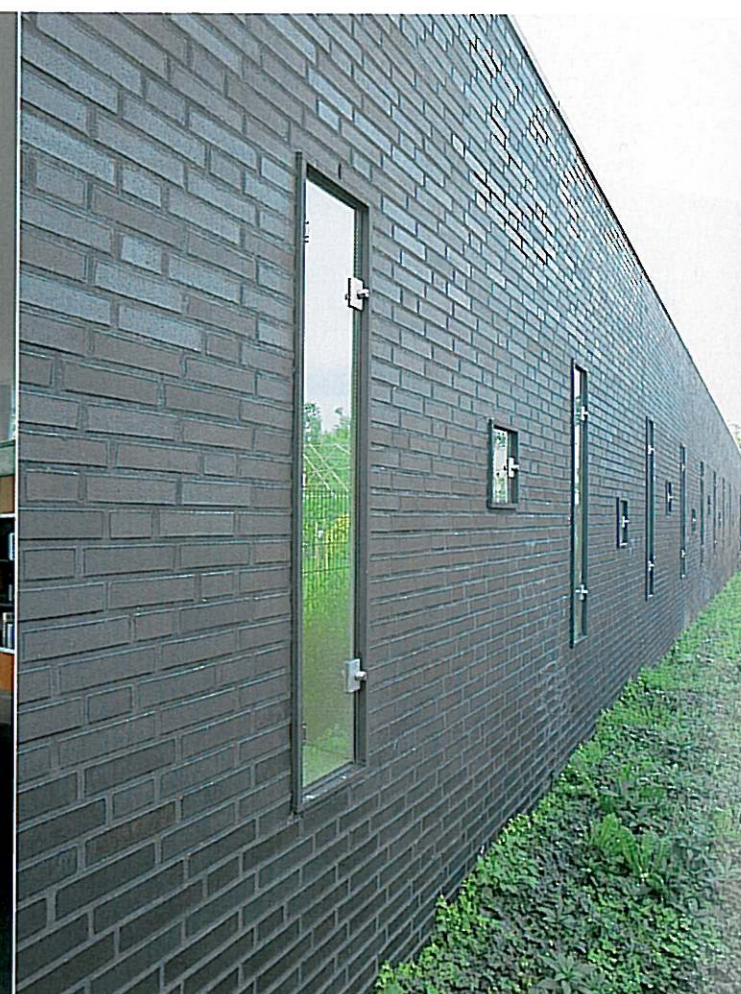
Om de verlichting in het zwembad te kunnen repareren zijn aan de achterzijde van het zwembadgebouw ramen met slotjes gemaakt.

mogelijk naar de erfafscheiding toe gebouwd is. 'Wij hebben binnen de randvoorwaarden van het bestemmingsplan die maximale grens gezocht.' De royale afmeting van de kavel wordt nog eens versterkt door de ligging van het zwembadgebouw; evenwijdig aan de erfafscheiding met de burens. Lengte en breedte worden zo extra benadrukt.