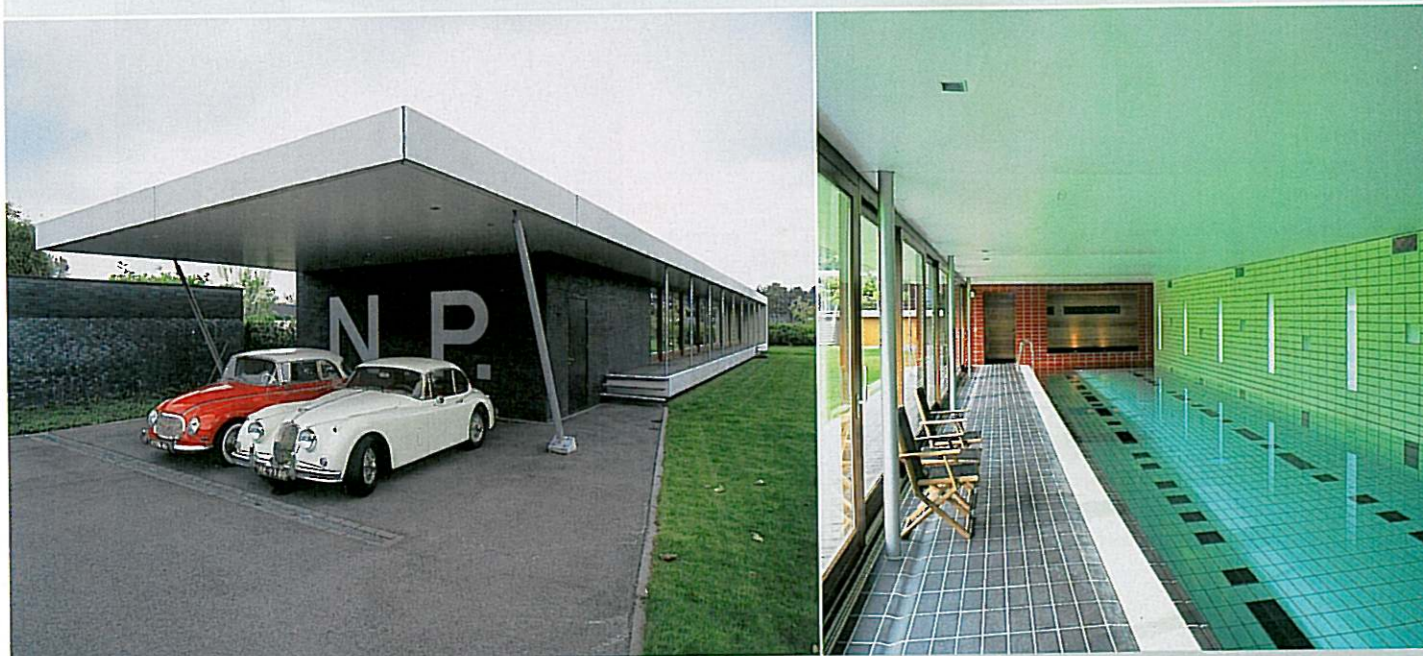
De letters N.P. staan niet voor Niet Parkeren, maar voor de initialen van de opdrachtgevers. Vanaf de weg is deze parkeerplek overigens niet te zien.