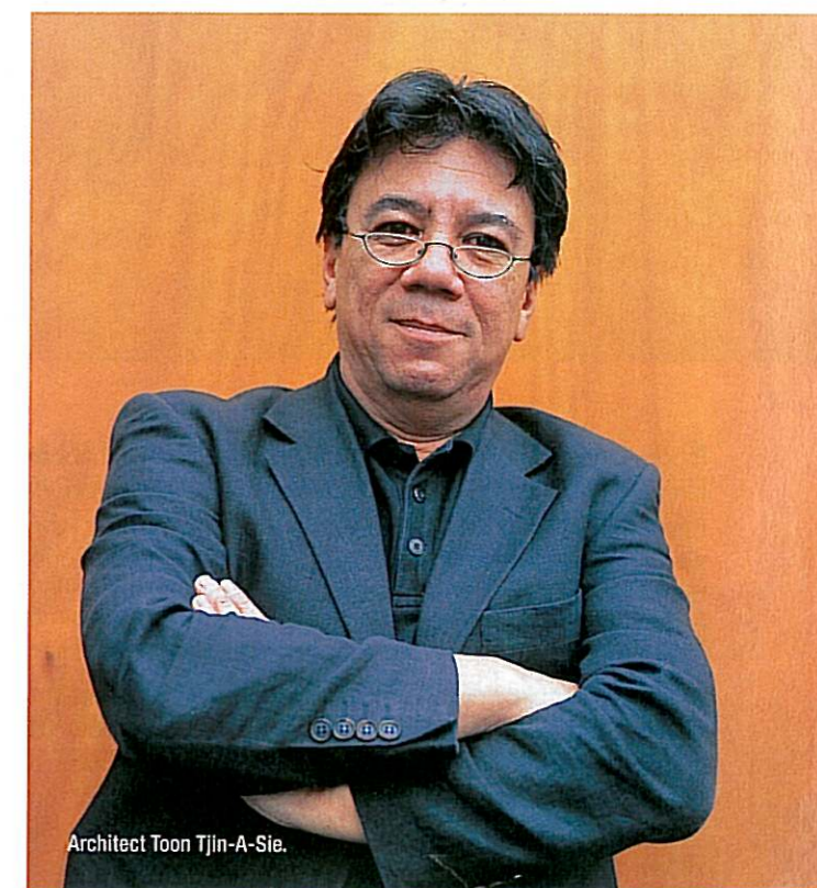
Architect Toon Tjin-A-Sie.

Dat de voorzijde als een veilige vesting oogt, komt doordat de villa op een terp ligt. De tuin is daardoor totaal afgeschermd van de straat. Optimale privacy dus. 'De entree is de enige plek waar je letterlijk dwars door de woning kunt kijken.' Dit heeft extra effect doordat de woning aan weerszijden zoveel